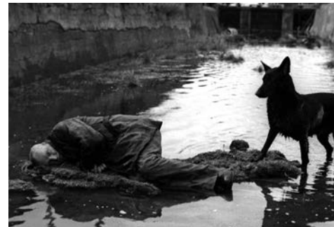
Stalker (režie: Andrej Tarkovskij, 1979)

Jinými slovy, na Tarkovského se můžeme dívat jako na autora světů těsně před apokalypsou nebo po ní. Pociťování konce světa bylo vlastní jak středověkým chiliastům, tak lidem, co prožili druhou světovou válku, těm, kteří byli svědky a přeživšími obětmi výbuchu jaderné elektrárny, či těm, již ztratili domov a nedokázali a možná ani nechtěli v jiné zemi najít nic útěšného, protože je zde ubíjela všudypřítomná masová kultura. Vrcholným paradoxem toho je, že Tarkovskému se nakonec jako jeden z mála amerických filmů líbil Terminátor , protože odpovídal jeho chmurným představám budoucnosti.