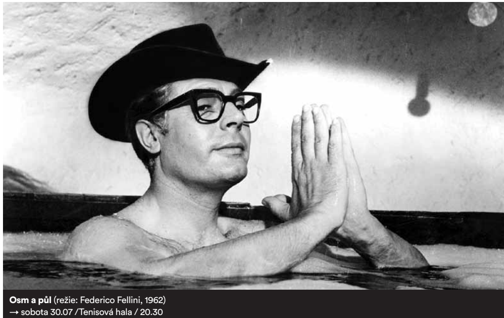
Osm a půl (režie: Federico Fellini, 1962) → sobota 30.07 / Tenisová hala / 20.30

Cesta do fantazie je jedním z nejslavnějších děl anime. V rámci tohoto směru pak existuje celá řada zajímavých odnoží. Možná jste zaznamenali, že teď frčí ve fanouškovských komunitách párování hlavních mužských hrdinů z nejrůznějších seriálů. Benedict Cumberbatch a Martin Freeman o tom ví díky Sherlockovi své. Japonské anime má ale pro tuto homosexuální lásku přímo legitimní žánr