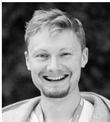
Autor má na starost odborný/industry program LFŠ.

Redakce Listů mi zákeřně vyfoukla mou největší srdcovku a doporučuje vám ji sama na dnešní páté stránce – Cesta do fantazie mě spolehlivě provedla každým životním splínem. Dnešek je však našťastí srdcovkami nabitý. Krom mrazivého Ucha a dechberoucího Saulova syna promítáme také Felliniho Osm a půl , takže já mám jasno. Odjedu s milovaným Guidem, kterého bych chvílemi zabil, hledat zase trochu klidu do lázni – 20.30 v Tenisové hale.