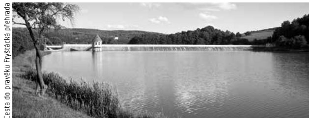
Cesta do pravěku Fryštácká přehrada

Zlínský kraj vždy byl a stále je oblíbeným místem filmařů. Je to i díky tomu, že firma Baťa založila v 30. letech minulého století ve Zlíně filmové ateliéry. Původně zde byly natáčeny snímky propagující značku Baťa, postupem času zde ale začaly vznikat také hrané filmy, zejména pro děti a mládež. O rozvoj nových talentů se starají dvě zlínské filmové školy.