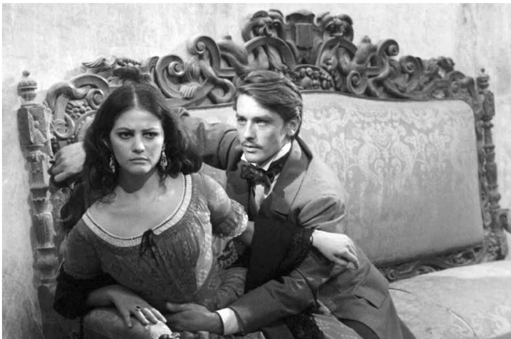
Gepard (režie: Luchino Visconti, 1963) → úterý 26.07. / Klub kultury / 17.30

Luchino Visconti sice natočil čtrnáct celovečerních snímků, skoro stejný počet se mu ale nepodařilo dostat do výroby. Ve formě scénářů tak zůstaly například tyto projekty: adaptace prvotiny Roberta Musila Zmatky chovance Törlesse (nakonec se knihy ujal německý režisér Volker Schlöndorff), adaptace románu